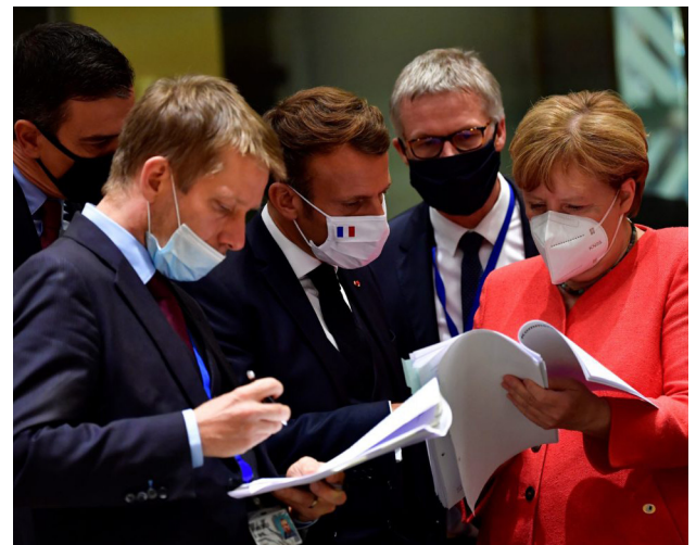
Spain's Prime Minister Pedro Sanchez, French President Emmanuel Macron and German Chancellor Angela Merkel look into documents during an EU summit in Brussels on July 20, 2020, as the leaders of the European Union hold their first face-to-face summit over a post-virus economic rescue plan.

“On July 21st 2020 the European Union reached consensus over the budget allocated to a new temporary emergency recovery instrument, Next Generation EU, to help repair the immediate economic and social damage brought by the COVID-19 pandemic. However, doubts persist on whether the grants will be sufficient to address real economic problems, contain the unemployment rate, and to rethink fiscal redistribution to offset growing social inequalities. What future steps should the EU take to create a resilient Europe based on true solidarity, overcoming the strain implied by negotiations?”