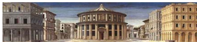
Tavola di attribuzione incerta La Città ideale