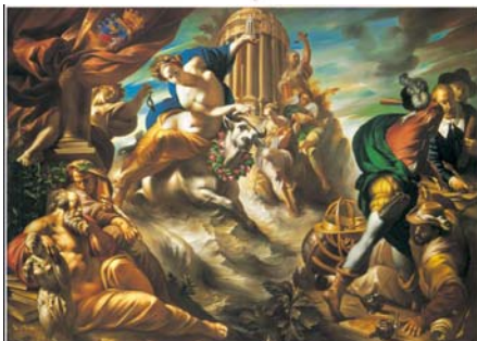
Allegoria d'Europa Bruno d'Arcevia, 1992

Il tempo della fiducia Convegno per genitori e personale della scuola Ancona, 14 maggio 2005