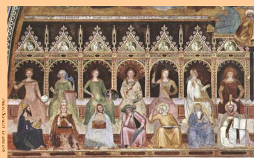
Seconda edizione a.s. 2004-05

Documenti consultabili sul sito www.marche.istruzione.it