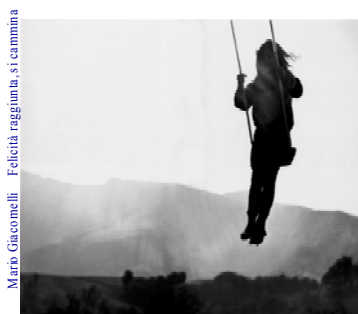
Mario Giacomelli Felicità raggiunta si cammina