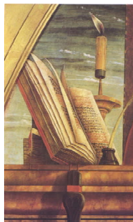
Carlo Crivelli – Pietà (particolare)