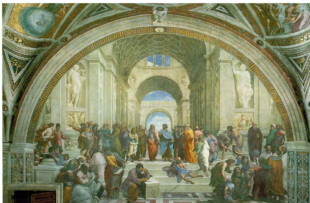
Raffaello La scuola di Atene

Ministero dell'Istruzione, dell'Università e della Ricerca Ufficio Scolastico Regionale per le Marche Direzione Generale