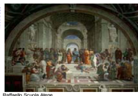
Raffaello Scuola Atene

Istituto Comprensivo Ancona Centro Sud-Est via Ciotone, 1 – 60123 Ancona