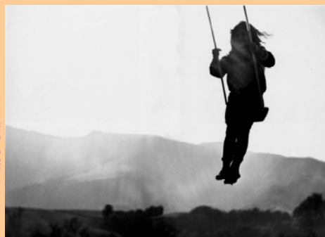
Terza edizione a.s. 2005 -06