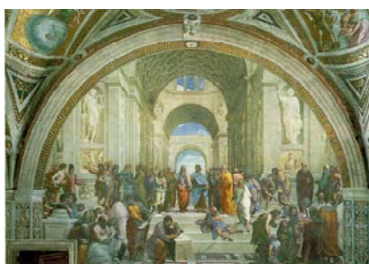
Raffaello La scuola di Atene