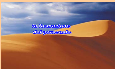
Prima edizione a.s. 2003-04