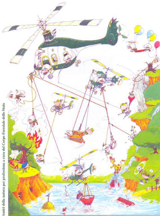
Amici della natura per professione a cura del Corpo Forestale dello Stato

Educare alla sicurezza Ancona, 16 aprile 2005