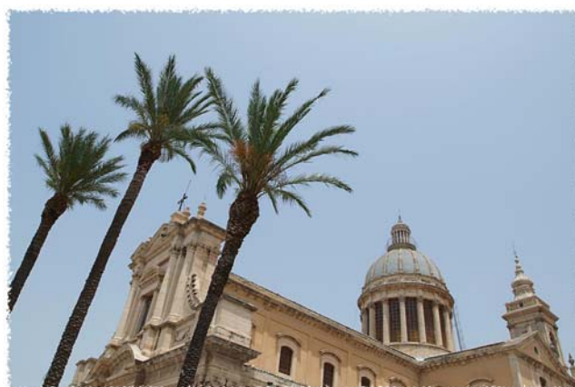
2. Comiso - Chiesa Maria SS Annunziata