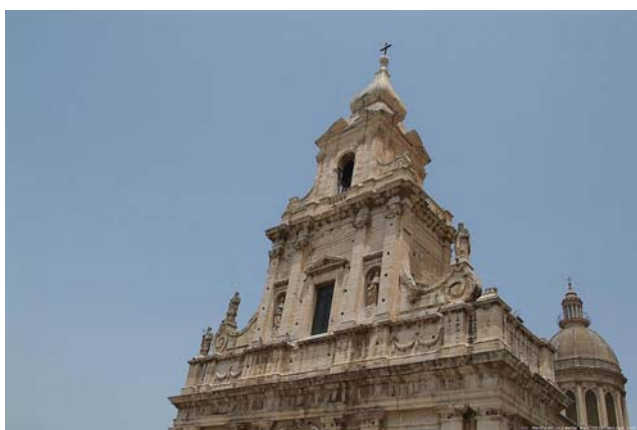
1. Comiso - Chiesa Madre

Art. 20 Il calendario delle prove verrà pubblicato e comunicato alle scuole partecipanti una settimana prima del concorso.