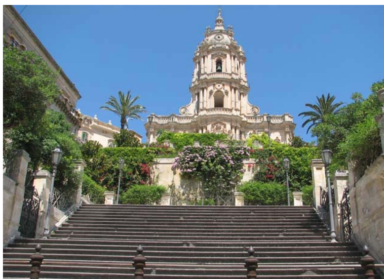
4 Modica - Scalinata che porta al Duomo di San Giorgio