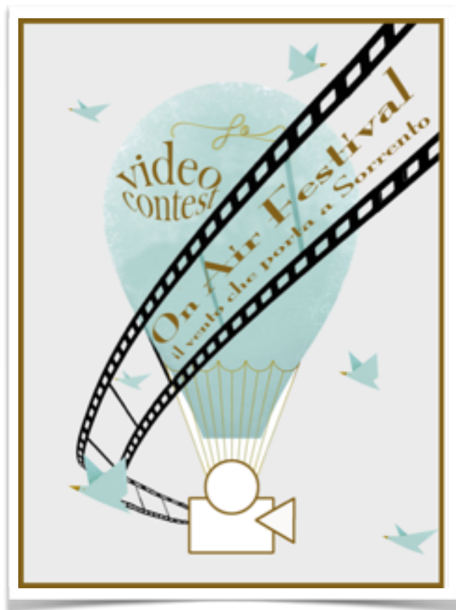
On-Air Festival - il vento che porta a Sorrento

È gratuito e si svolgerà in due momenti, uno interamente on-line e un altro live a Sorrento dal 28 al 30 aprile 2014