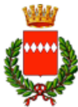
CITTA' DI SORRENTO