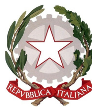
M.I.U.R. UFFICIO SCOLASTICO REGIONALE - CAMPANIA