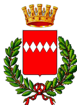
CITTA' DI SORRENTO