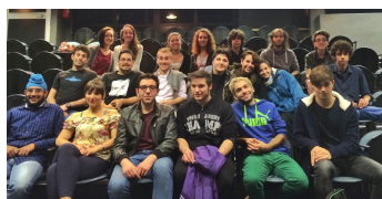
Festival 2014: la Giuria di Ragazzi

Il Festival delle Scuole è un Concorso di Teatro a cui sono ammessi, previa compilazione della domanda allegata, gruppi di teatro delle Scuole Secondarie di 2° grado . Il Concorso si svolge durante il mese di maggio e la Cerimonia di Premiazione dei vincitori si tiene domenica 31 maggio 2015 all'ITC Teatro di San Lazzaro. L'iscrizione è gratuita . Per partecipare è sufficiente, dopo aver letto il bando di concorso, compilare e firmare il modulo di iscrizione e la scheda di partecipazione allegati e inviarli con le modalità e nei tempi indicati. I gruppi partecipanti si esibiscono davanti a una giuria composta interamente da ragazzi , provenienti da tutte le scuole in concorso, che dovranno valutare testo e recitazione, grado di difficoltà e originalità, costumi, scene e musiche degli spettacoli in gara. La giuria è senz'altro una delle cose più belle nonché il simbolo di questa rassegna dedicata ai più giovani. Al termine della manifestazione, la scuola prima classificata riceverà un premio in denaro pari a euro 1.500 , che la scuola si impegna a spendere nell'organizzazione di attività culturali destinate agli allievi, nonché il diritto a partecipare all'edizione 2016 della Manifestazione Teatro Lab organizzata dal Centro Teatrale Europeo Etoile sul territorio della Provincia di Reggio Emilia.