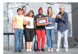
I vincitori dell'edizione 2014: Istituto "Ceccato" di Montecchio Maggiore (VI)