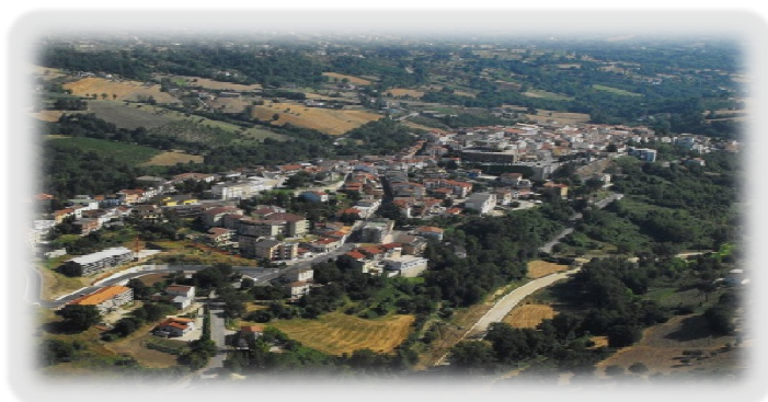
CITTÀ DI MIRABELLA ECLANO