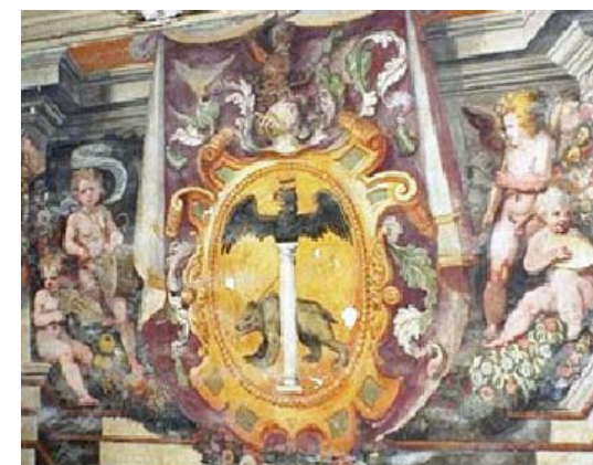
Stemma Cesarini, Sec. XVI

Montecosaro (MC) , Teatro delle Logge, Piazza Trieste n. 11