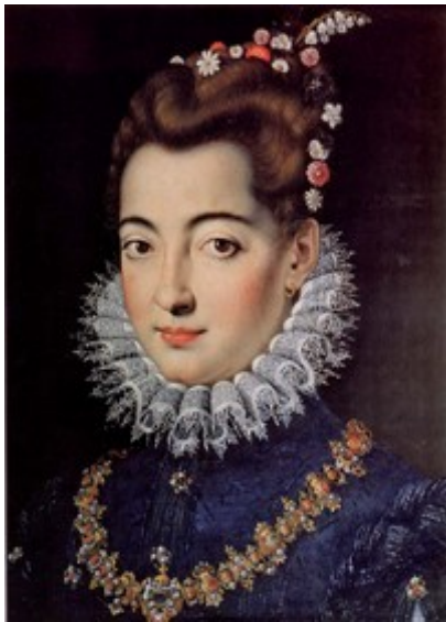
Clelia Farnese Cesarini (1556 ca. - 1613)

Ore 09.15: Alfredo MAULO (Curatore del Sito www.ducatocezarini.it ): L'investitura feudale di Giuliano I Cesarini e l'esproprio dei Palazzi dei Priori di Civitanova e Montecosaro alla metà del Cinquecento.