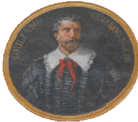
Giuliano III Cesarini (1618-1665)