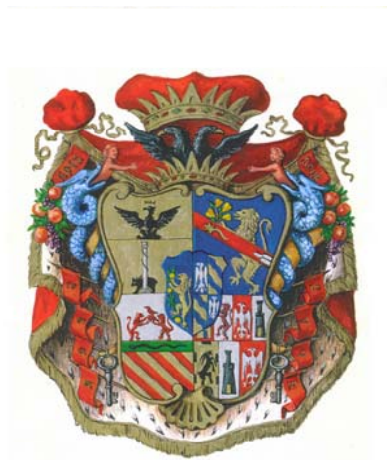
Stemma Sforza Cesarini

LA CITTADINANZA È INVITATA A PARTECIPARE.