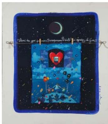
(opera di Andrea Agostini)