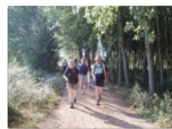
Cammino di Santiago

Si svolge annualmente, d'estate, in prossimità delle grandi capitali europee e delle città che hanno segnato la storia della nostra cultura. Ogni anno si sceglie una tematica di particolare rilevanza esistenziale, intorno alla quale si realizzano i "Megadialoghi" (gruppi di discussione intorno al tema proposto) e i "Notturmi" (veglie artistiche).