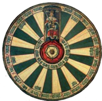
Merlino, il Soldato Eterno

D a che parte sta il bene, la ragione, il diritto di uccidere il nemico? E in nome di quale ideale è legittimo farlo? Anselmo Merlino, il Mago Merlino che abbiamo conosciuto nel ciclo bretone della tavola rotonda, se lo chiede da un'eternità. Già, perché Merlino, soldato eterno, è ancora sulla terra, dopo 1.600 anni.