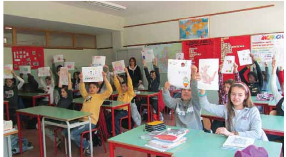
Lo scambio disegni tra gli studenti della scuola media di Montebelluna (TV) e i bambini della scuola Enrico Visconti di Ngarigne, Senegal.

Questa attività è gratuita: prevede solo il costo di invio dei disegni dalla scuola italiana alla sede della Fondazione "aiutare i bambini" a Milano.