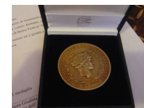
Helios Festival 2010 Medaglia del Presidente della Repubblica

Helios onlus - www.heliosnews.it – heliosonline@libero.it , Tel. Fax 0735.762316 – Cell. 338.3769418 Siamo anche su Facebook all’indirizzo: http://www.facebook.com/heliosnews.redazione