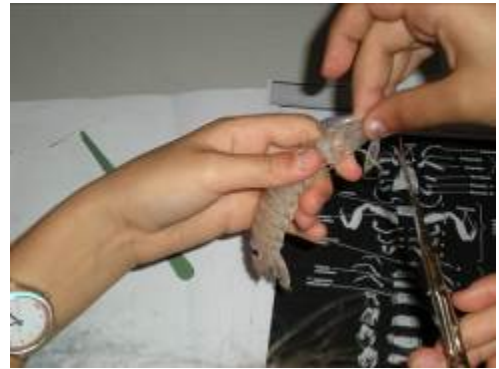
Figura 14: studenti durante l'esercitazione di anatomia e fisiologia di vertebrati ed invertebrati marini.