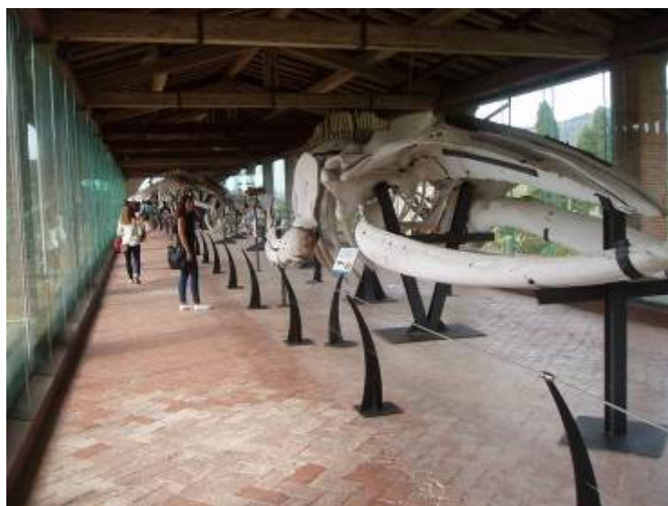
Figura 9: sala dei Mammiferi marini al Museo di Calci.