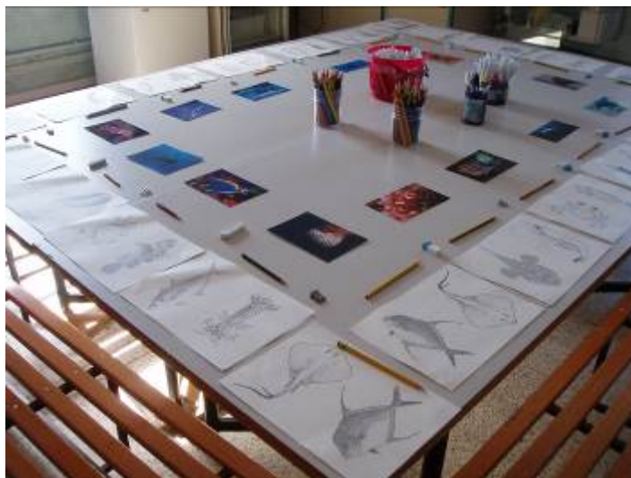
Figura 10: tavolo pronto per disegni e schede didattiche per i più piccoli.