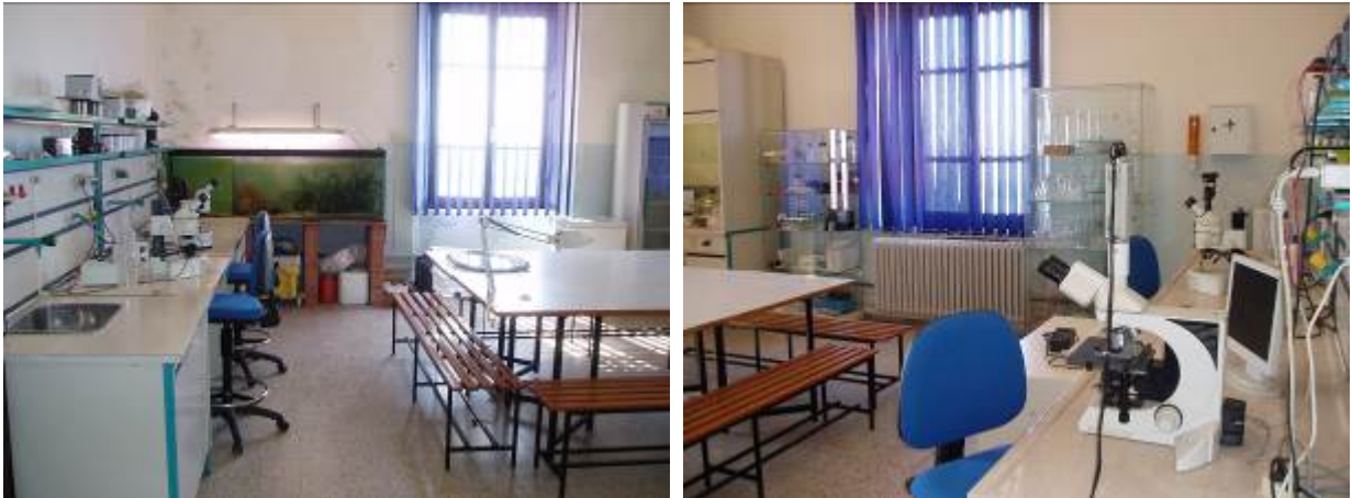
Figura 4: laboratorio per la ricerca scientifica.