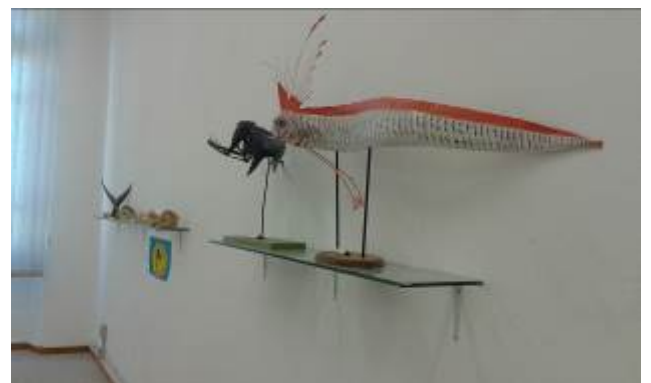
Figura 3: alcune immagini del Museo degli animali marini