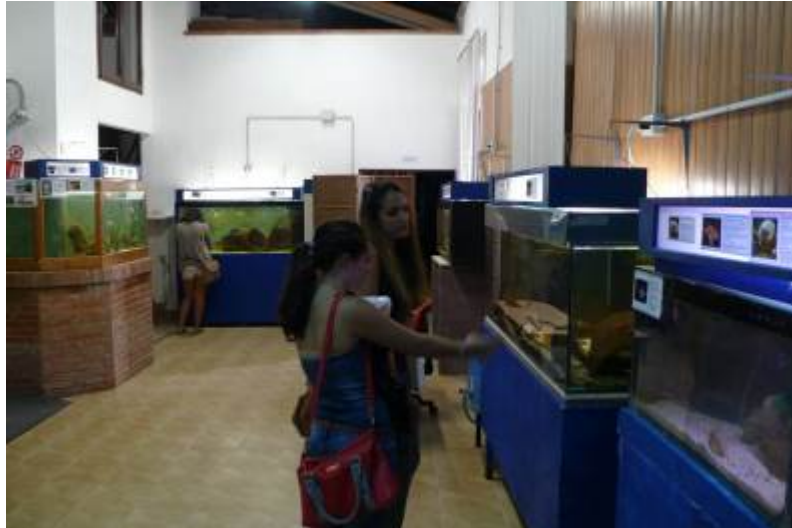
Figura 2: alcuni studenti in visita all'Acquario Marino Mediterraneo.