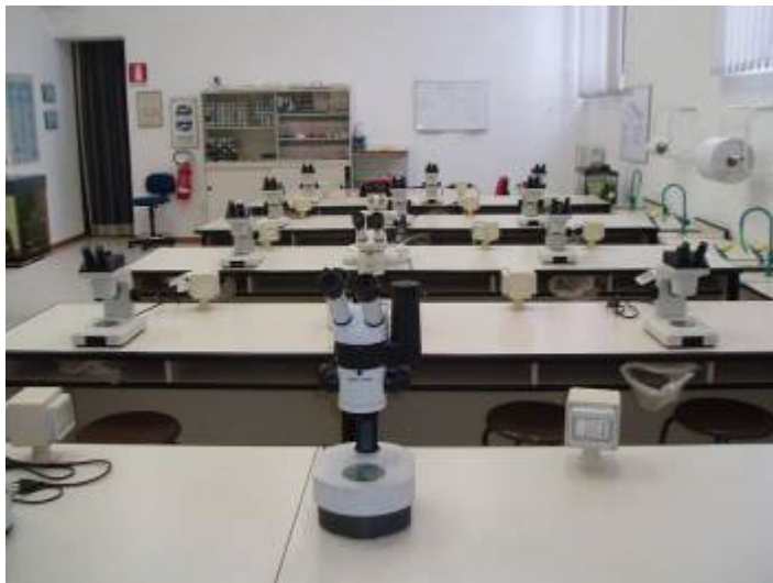
Figura 5: laboratorio didattico con 14 stereomicroscopi e fotocamera applicata ad uno di essi.