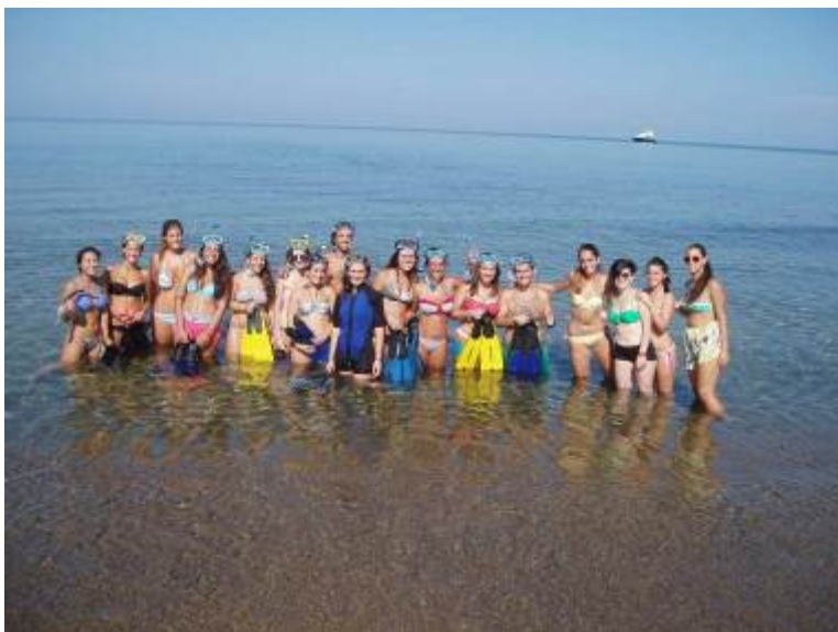
Figura 8: alcuni studenti pronti per lo snorkeling a Baratti.