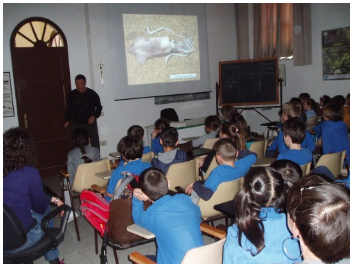
Figura 1: sala da proiezione.