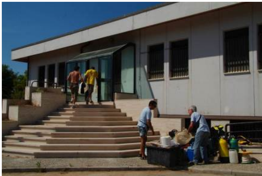
Figura 7: ingresso del laboratorio a Pianosa.

L'Istituto di Biologia ed Ecologia Marina di Piombino propone percorsi didattici con livelli diversi di complessità a seconda che si rivolgano a scuole elementari, scuole medie o scuole superiori che comprendono attività per l'acquisizione di una conoscenza della biologia ed ecologia marina.