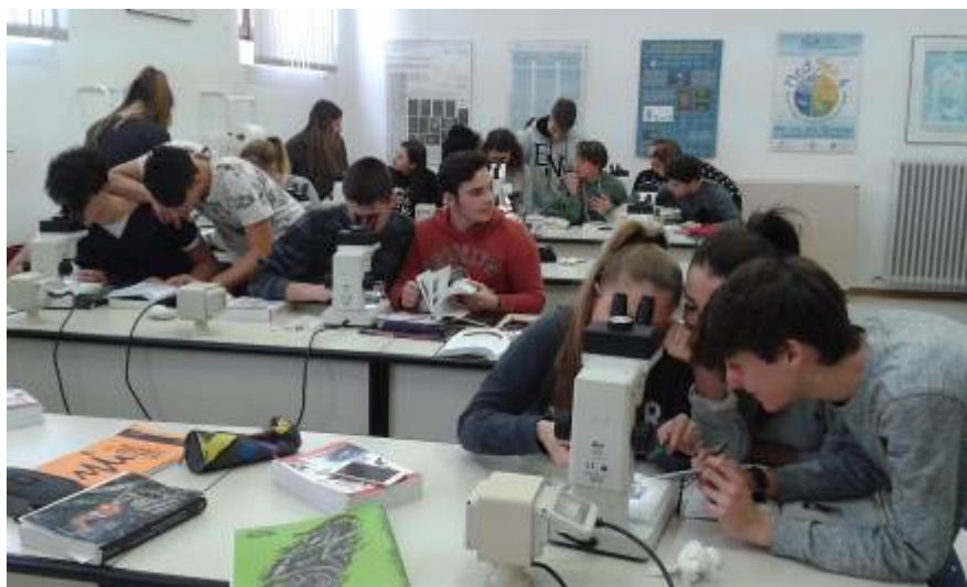
Figura 12: studenti durante la determinazioni tassonomica degli animali campionati.