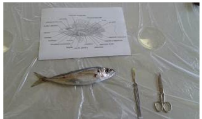
Figura 15: tavolo pronto per l'esercitazione di anatomia (a sinistra) e piano di lavoro per coppia di studenti (a destra).