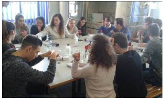
Figura 13: tavolo pronto per l'esercitazione sulla chimico-fisica dell'acqua (a sinistra) e alcuni studenti durante l'esercitazione sulla chimico-fisica dell'acqua (a destra).

Un altro tipo di esercitazione è quella di anatomia e fisiologia di animali e vegetali marini in cui i ragazzi con guanti, bisturi e forbici hanno la possibilità di andare a studiare più da vicino le strutture interne di alcuni organismi animali e vegetali (figure 14 e 15).