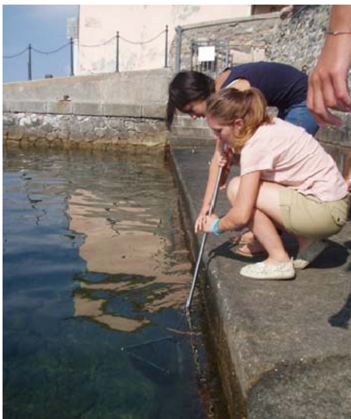
Figura11: studentesse durante il campionamento.