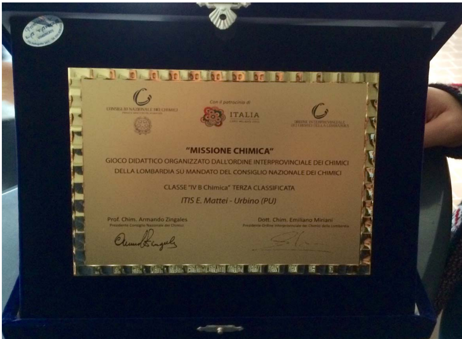
TARGA RICORDO DELLA MANIFESTAZIONE